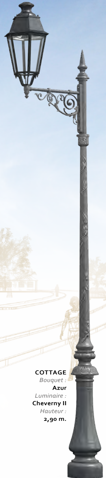
COTTAGE Bouquet : Azur Luminaire : Cheverny II Hauteur : 2,90 m.