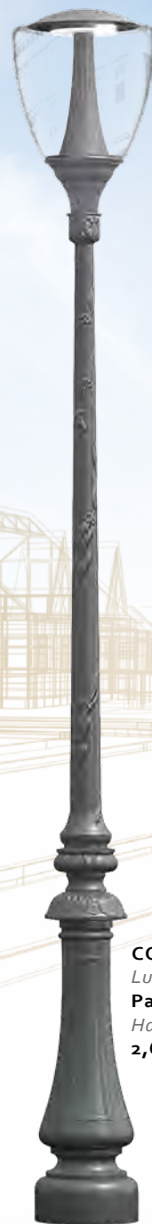
COTTAGE Luminaire : Palma Hauteur : 2,60 m.