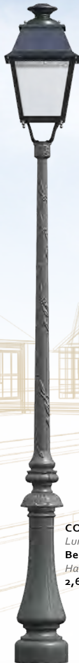
COTTAGE Luminaire : Beauregard II Hauteur : 2,60 m.