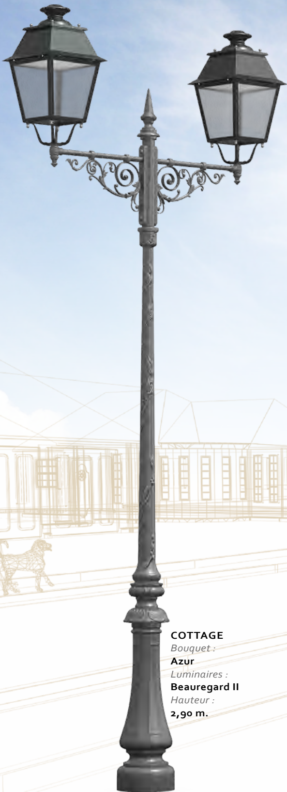
COTTAGE Bouquet : Azur Luminaires : Beauregard II Hauteur : 2,90 m.